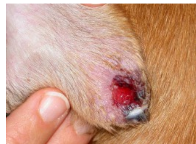
Leishmaniose-bedingte Hautveränderung an Hundeohr