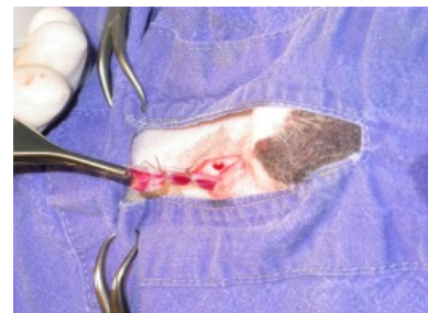
Rest des Samenleiters wird zurück in die Bauchhöhle gelassen