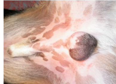
Kastration beim Rüden, OP-Feld

Mehr Informationen zu der modernsten, reversiblen Kastrationsmethode mittels Langzeitimplantat finden Sie unter http://www.animalreproduction.ch